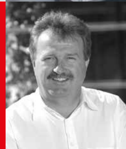
Aesculap AG, Tuttlingen Rudolf Zepf

Wir sind auf optimal abgestimmte Frühwarnsysteme in der Gebäudeautomation angewiesen. Betriebsbereitschaft und Betriebssicherheit stehen klar im Vordergrund. Gerade bei den sehr umfangreichen Baumaßnahmen in der letzten Zeit hatten wir vor allem im Bereich Schaltschrankbau und Dienstleistung vor Ort einen kompetenten Partner. Wir wünschen der Firma Fiehn alles Gute für die Zukunft.